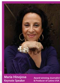
María Hinojosa Keynote Speaker Award-winning Journalist & Producer of Latino USA

Saturday, March 21 st , 2015 MSU Kellogg Hotel & Conference Center East Lansing, Michigan 8am-5pm