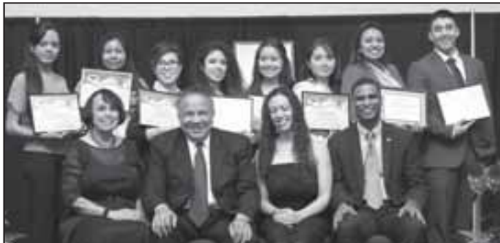
Estudiantes que obtuvieron becas