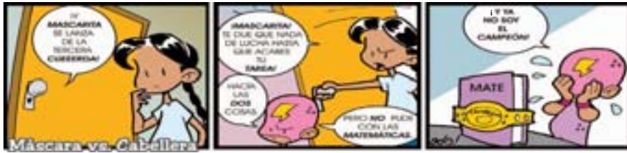
por Adrián Ramos