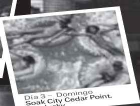
Día 3 - Domingo Soak City Cedar Point, Sandusky

Visite DiscoverOhio.com/Multicultural o llame a 888-901-OHIO