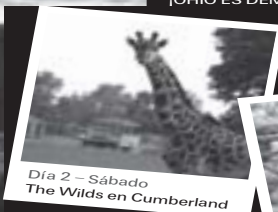
Día 2 - Sábado The Wilds en Cumberland