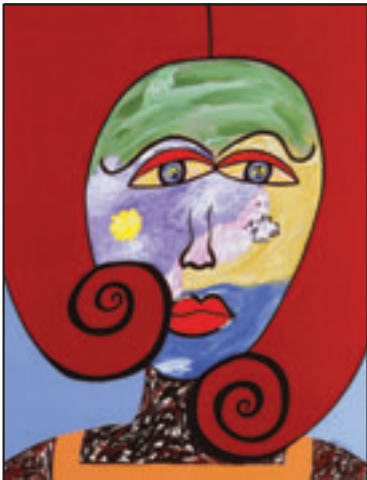
"Kayla" by Willie Terrell

mentary After Innocence and a night of spoken word featuring formerly incarcerated poets, their mentors, and New York poet Eric "EZ" Waters .