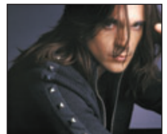
Read all about Juanes and Lo mejor de la farándula on Page 17.