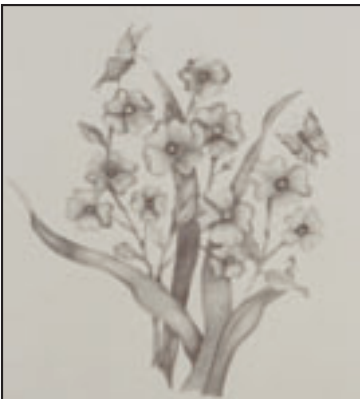
"Flowers Butterflies" by Lessie 'Dawna' Brown